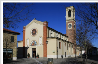
Visitazione di Maria a s. Elisabetta