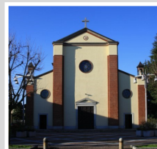
Ss. Lorenzo e Sebastiano