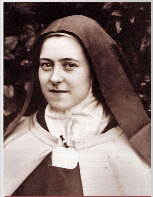
1 OTTOBRE SANTA TERESA DI GESÙ BAMBINO E DEL SANTO VOLTO Dottore della Chiesa universale (1873-1897)