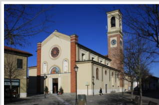
Visitazione di Maria a s. Elisabetta