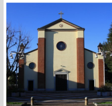
Ss. Lorenzo e Sebastiano