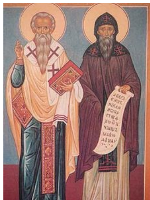
Ss. Cirillo e Metodio, patroni d'Europa