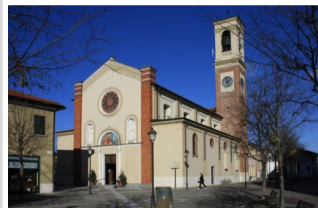
Visitazione di Maria a s. Elisabetta