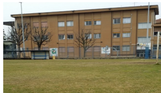
La scuola media s. Ambrogio

Iscrizioni in segreteria parrocchiale entro il 19.2