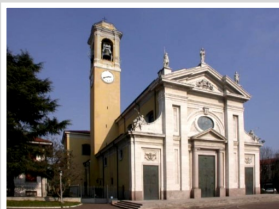
Ss. Gervaso e Protaso