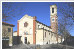
Visitazione di Maria a s. Elisabetta