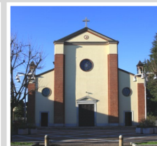
Ss. Lorenzo e Sebastiano