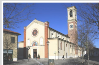
Visitazione di Maria a s. Elisabetta