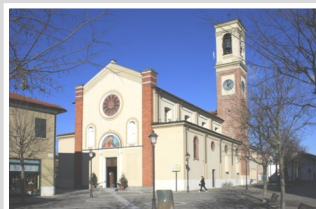
Visitazione di Maria a s. Elisabetta