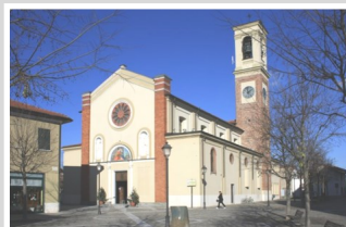
Visitazione di Maria a s. Elisabetta