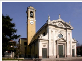
Ss. Gervaso e Protaso

Ss. Gervaso e Protaso 0331 551324 Gesù Crocifisso 0331 554446 Visit. di Maria a s. Elisabetta 0331 551385 Ss. Lorenzo e Sebastiano 0331 551452 Oratorio s. Stefano