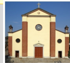
Ss. Lorenzo e Sebastiano