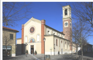
Visitazione di Maria a s. Elisabetta