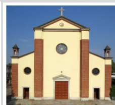
Ss. Lorenzo e Sebastiano