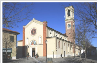
Visitazione di Maria a s. Elisabetta