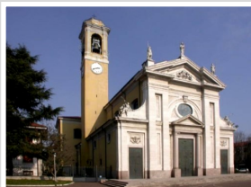
Ss. Gervaso e Protaso

Informatore della Comunità Pastorale S. Ambrogio - Parabiago Sito Internet: www.chiesadiparabiago.it