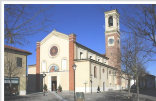
Visitazione di Maria SS. a S. Elisabetta