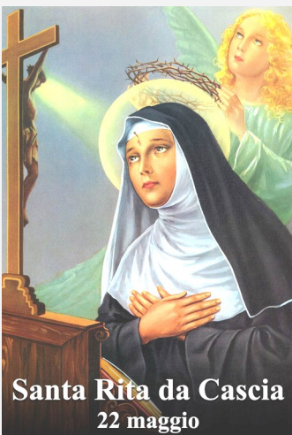
Santa Rita da Cascia 22 maggio