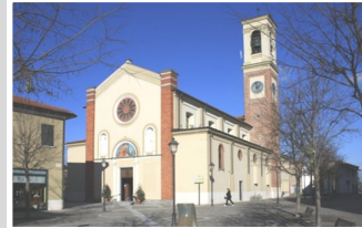
Visitazione di Maria SS. a S. Elisabetta