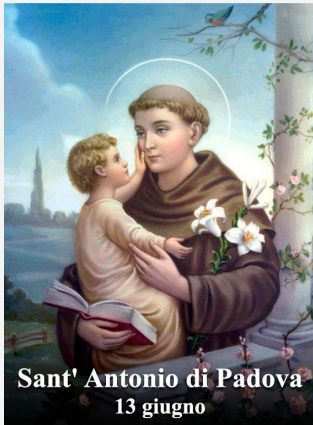
Sant' Antonio di Padova 13 giugno