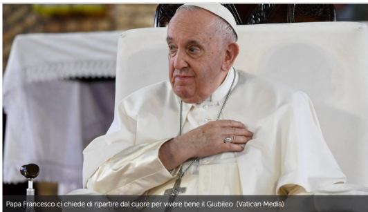
Papa Francesco ci chiede di ripartire dal cuore per vivere bene il Giubileo.

Speriamo nello sviluppo dei primi timidi passi: che la tregua sia duratura. Dobbiamo dirci sempre più con voce alta che questi PRIMI PASSI VERSO LA PACE SARANNO DURATURI SE IL NOSTRO CUORE SI CONVERTIRA' A DIO CHE E' IL DIO DELLA PACE E AL SUO MESSAGGERO: CRISTO, NOSTRA PACE.