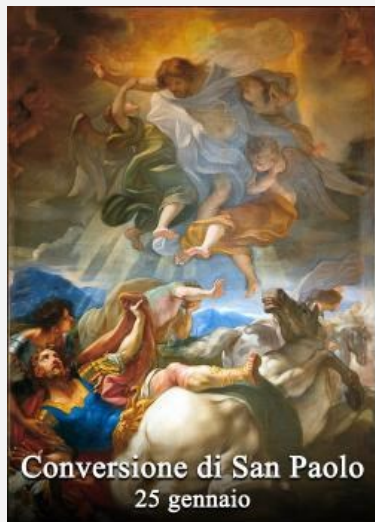
Conversione di San Paolo 25 gennaio

Buon anno nuovo scegliendo una ripartenza possibilmente sapiente e credente!