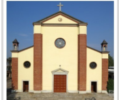
Ss. Lorenzo e Sebastiano