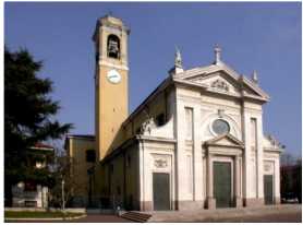
Ss. Gervaso e Protaso