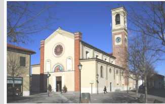
Visitazione di Maria SS. a S. Elisabetta